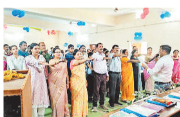
कोतरा में आयोजित शिक्षक पालक सम्मेलन में मौजूद शिक्षक व अभिभावक।