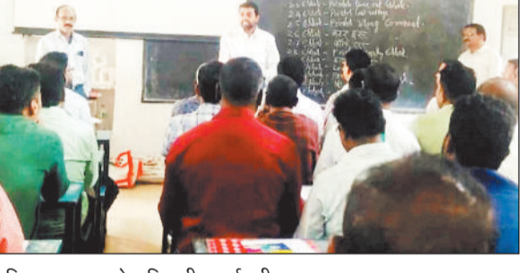
प्रशिक्षण प्राप्त करते अधिकारी- कर्मचारी।