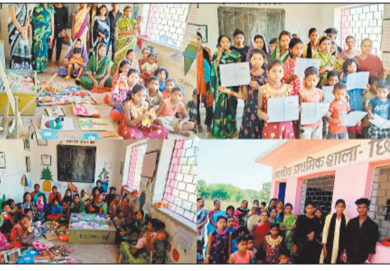
समारंभ में शामिल बच्चे।

पथलगांव। प्राथमिक शाला छिंदबहरी में ग्रीष्मकालीन अवकाश घोषित होते ही बच्चों की उत्सुकता को देखते हुए 10 दिवसीय समारंभ का आयोजन किया जा रहा है। समारंभ में बच्चों को विभिन्न प्रकार की शैक्षणिक और ज्ञानवर्धक गतिविधियां, खेल, नृत्य, गीत संगीत, आर्ट कुकिंग जैसे गतिविधियां सिखाए जा रहे हैं। शाला समिति व माताओं द्वारा बीच-बीच में सहयोग प्रदान किया जा रहा है। घर पर यह सब सिखने के लिए प्रेरित किया गया। साथ ही बताया गया कि जरूरत पड़ने पर घर में बड़ी बहन,माता-पिता व दोस्तों से फोन के माध्यम से सहायता लेकर भी सिखा जा सकता है। कार्यक्रम का आयोजन F1N और नवाजतन के उद्देश्य को ध्यान में रखकर भी किया गया है। नवाजतन के तहत बच्चों को स्वयं से सीखने के लिए प्रेरित भी किया है स्वयं से भी आप सीख सकते हो यह आत्मविश्वास उनमें लाने की