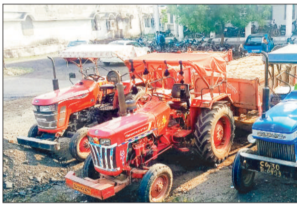
अवैध परिवहन में लगे जब्त वाहन।