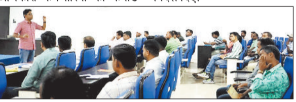
बैठक में जानकारी देते अधिकारी।