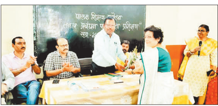
चांदमारी शासकीय विद्यालय में आयोजित शिक्षक पालक सम्मेलन में मौजूद शिक्षक व अभिभावक।