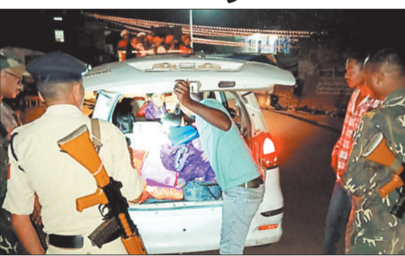
वाहन चेकिंग करती पुलिस।

एक्ट के 02 प्रकरणों में कार्यवाही की गई है। साथ ही क्षेत्र के निगरानी, गुण्डा बदमाशों की चेकिंग कर उन्हें थाना हाजिर के निर्देश दिये गये हैं। पथलगांव अनुविभाग के थाना पथलगांव धारा 107, 116(3) के तहत-12, थाना बागबहार धारा-05, थाना तुमला धारा 01, धारा 109 सीआरपीसी के तहत थाना पथलगांव बागबहार धारा 02-02 प्रकरण, धारा 110 सीआरपीसी के तहत चौकी कोतवा 01 प्रकरणों में कार्यवाही की गई है। आबकारी एक्ट के तहत थाना बागबहार धारा 01 प्रकरण में कार्यवाही की गई है। साथ ही क्षेत्र के निगरानी, गुण्डा बदमाशों की चेकिंग कर उन्हें थाना हाजिर के निर्देश दिये गये हैं।