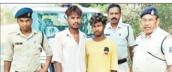
पुलिस गिरफ्तार में आरोपी।

हरिभूमि न्यूज ▶▶ जशपुरनगर जशपुर जिले के थाने में एक ग्राम की 34 प्राथियां ने 28 अप्रैल को रिपोर्ट दर्ज कराई कि 17 अप्रैल के दोपहर में यह अपनी 14 वर्षीय पुत्री को अपने खेत-बाड़ी में लगे फसल को देख-रेख कर रहे थे भेजी थी, जो शाम-रात तक वापस नहीं आई। उसकी पुत्री 19 अप्रैल को प्रातः में वापस घर आई और गुमशुम रहने एवं स्वास्थ्य खराब रहने पर प्राथियां द्वारा पूछताछ करने पर बताया कि 17 अप्रैल को उबत खेत बाड़ी के पास 03 व्यक्ति एक मोटर सायकल में